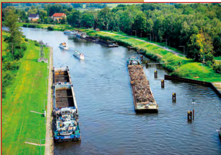
Widok z podnośni statków w Niederfinow

Urozmaicony teren sprzyja wędrowkom pieszym i rowerowym. Kanał Odra-Hawela oraz historyczny Finow zachęcają do rozważenia oferty lokalnych armatorów.