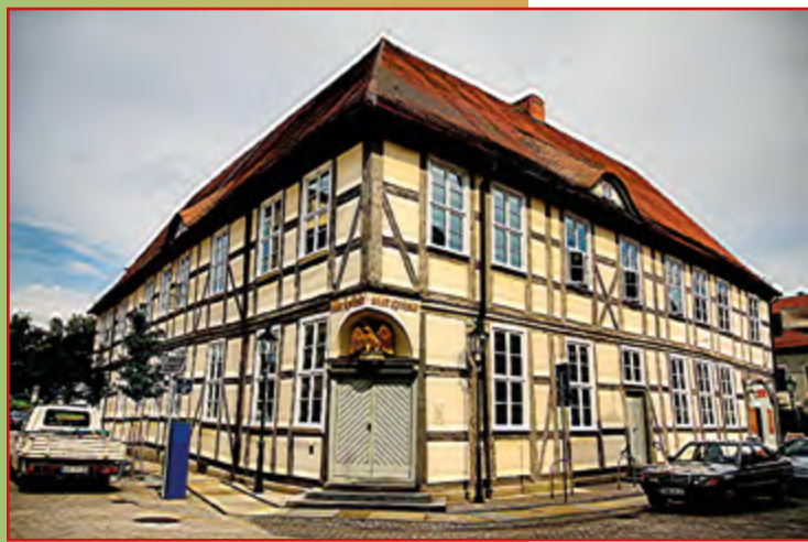
Muzeum miejskie w budynku dawnej apteki, Eberswalde

Pokaz, koncert, przedstawienie w każdą sobotę i to bezpłatnie? Tak jest od 2007 roku w Eberswalde. Latem imprezy odbywają się na rynku, a kiedy jest chłodniej w pobliskim Paul-Wunderlich-Haus. Zawsze o 10.30. „Guten Morgen Eberswalde” (Dzień dobry Eberswalde) to akcja, która w marcu 2014 roku doczekała się okrągłej rocznicy 350. wydania. Klasykiem, który zdobył uznanie poza regionem są letnie koncerty w klasztorze Chorin w ramach Chorińskiego Lata Muzycznego. Odbywają się one w każdy weekend lipca i sierpnia. I wreszcie, kto chciałby zobaczyć miasto Bernau w niecodziennym wydaniu, ten powinien je odwiedzić w weekend na przełomie maja i czerwca, kiedy odbywa się Festyn Husycki (Hussitenfest). Obchodzony jest na pamiątkę daremnej próby zdobycia miasta przez oddziały husyckie w 1432 roku. Wydarzeniu towarzyszą liczne pokazy walk, tańce, korowód, jarmark średniowieczny i wieczorna inscenizacja historyczna.